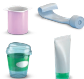
Pots et tubes